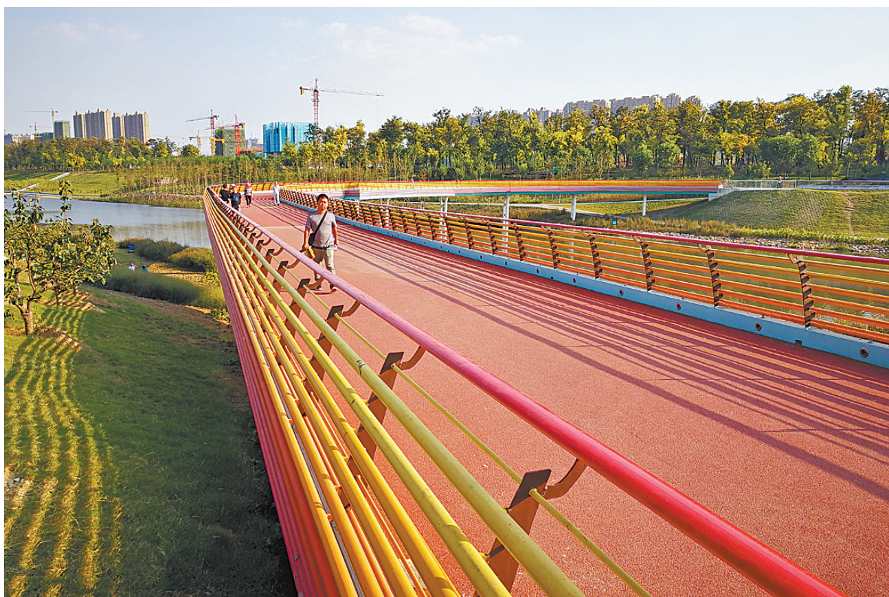
乌江河口公园的彩虹桥。

由于原来河床浅而窄,遇到大雨便洪水漫溢,建市以来我市对湛河进行过多次整治。其中,1957年至1961年,主要是河道加深拓宽治理,改变以前十年九涝现象;第二次是1982年,主要是疏浚河道,修整堤坡;第三次是1998年和2000年,分两期修建了湛北暗涵、湛河全线绿化以及市区河堤硬化、美化等。2014年,我市再次对湛河全线进行了提档改造,目前工程已接近尾声,河畅、水清、岸美、生态的风景美如画。