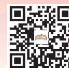
“@鹰城”网络微视频大赛网站