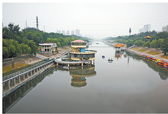
中兴路湛河桥西侧美景如画