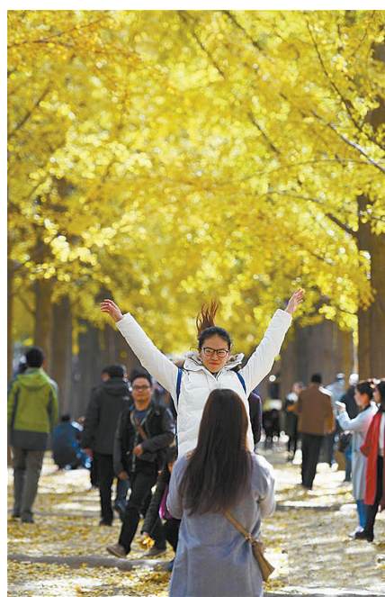
游人在钓鱼台国宾馆旁的银杏大道上拍照。

丹巴县位于四川甘孜藏族自治州东部,是甘孜州的“东大门”,以甲居藏寨为代表的“丹巴藏寨”被评为“中国最美的六大乡村古镇”之首。10月是丹巴旅游的最佳时间,此时,能欣赏到丹巴的彩林千阙风光。丹巴的古碉楼可追溯到秦汉时期,宏大的集体建筑流露出古韵古香,古人的智慧嵌于每块砖石中。在著名的甲居藏寨,碉楼挂满金黄的玉米,一派丰收的景象。藏寨从大金河谷层层向上攀缘,一直伸延到卡帕玛群峰脚下,整个山寨依着起伏的山势迤逦连缀,在相对高差近千米的山坡上,一幢幢藏式楼房落在红黄绿的树丛中,与青稞田构成了一幅色彩斑斓的天然画卷。康巴藏寨则依山面水,周围树木掩映,从河谷层层叠叠向上攀