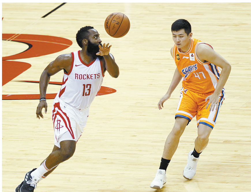
10月9日,火箭队球员哈登(左)在比赛中传球。

新华社休斯敦10月9日电(记者刘立伟 高路)中国球员周琦当地时间9日晚在本赛季NBA季前赛休斯敦火箭队的最后一次主场比赛中左膝关节扭伤。