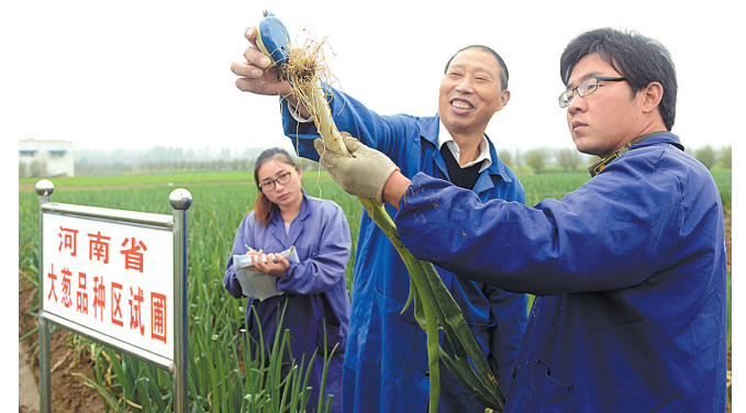
河南省首次大葱品种区域试验在我市展开。