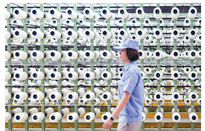
平煤神马集团“退城进园”2万吨浸胶帘子布项目。该项目采用世界一流的装备和工艺技术，生产汽车轮胎、飞机轮胎、工程轮胎用高性能锦纶66浸胶帘子布。