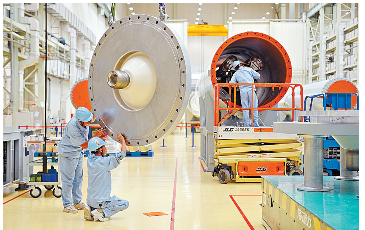
▲平高集团工人在组装组合电器。在创新驱动战略带动下，平高集团实现跨越式发展。

教育教学质量不断提升。2018年高考我市各项指标连续9年稳步增长，文理科各批次上线率均高于全省平均水平。