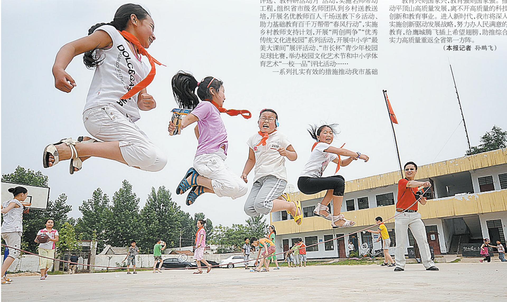
器材进校园，学生乐开颜。