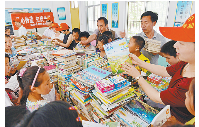
爱心图书送到山村小学。