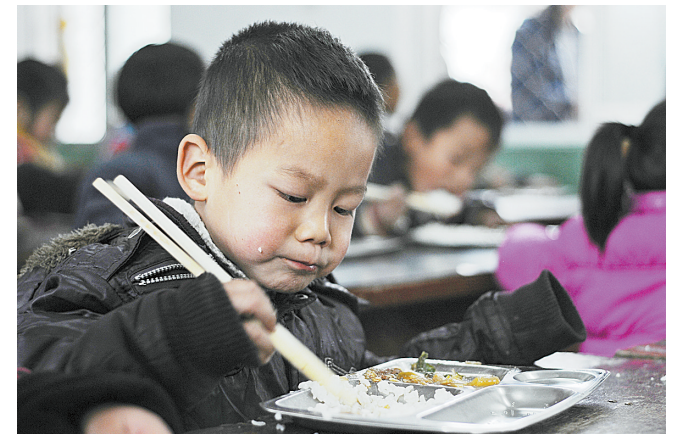
我市又一所小学享受“免费午餐”。