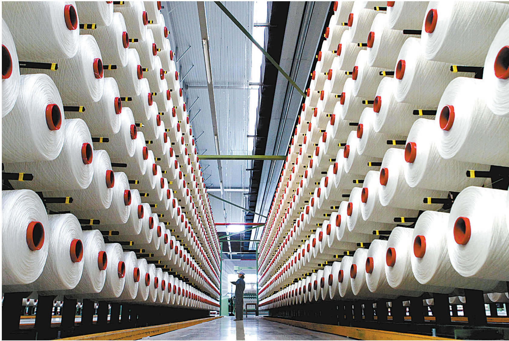
工人在生产车间忙碌。平煤神马集团2万吨高性能浸胶帘子布项目位于叶县境内的市化工业产业集聚区内，该项目总投资9亿元，产品主要用于飞机轮胎、工程轮胎等，2013年4月正式投产以来产销两旺。

肖长发是土生土长的平顶山人，今年52岁的他经营一家机械设备销售、租赁公司，生意做得风生水起。 “小时候听大人讲，姚孟电厂的烟囱又高又大，底部卡车能调头。”肖长发回忆道，上初中后，他渐渐知道了帘子布厂、平高集团这些企业。“可眼气上班的工人，他们吃的、穿的比一般人强，进企业当工人成为青春梦想。” 总有一些记忆让人回味无穷，总有一些年份让人刻骨铭心，总有一些事件给人力量。 2008年，我市规划建设了10家省级产业集聚区和一批各具特色的市级产业集聚区，一批重点项目纷纷落地。目前，10家省级产业集聚区入驻企业580家，成为工业经济发展新的增长极。 2008年底，平煤集团和神马集团实施战略重组，当年实现销售收入800亿元，2010年跨越千亿元大关，跃居中国企业百强。 2010年3月，平高集团整体划转至央企国家电网公司，站到了更高的起点上。2015年，集团销售逆势增长，实现销售收入111.55亿元。