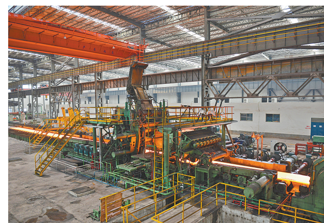
宝丰县翔隆不锈钢有限公司员工坚守在生产线上加紧生产。该公司于2014年3月17日开工建设，主要经营各种不锈钢卷板的加工和销售。该项目投产以来，产销两旺，除可满足落户宝丰县不锈钢产业园各项目的原材料供应外，还拉动不锈钢制品、电力、运输、建材、服务等行业的发展。