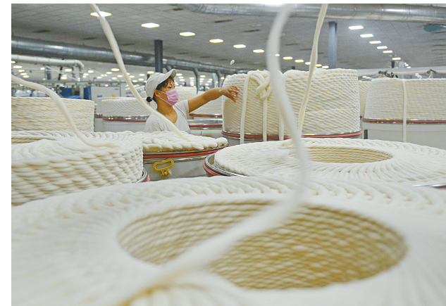
工人在生产车间加紧生产。舞钢市银龙集团始建于1988年，是集纺织、服装、塑编、皮革加工和进出口经营于一体的大型股份制民营企业，主要以生产高档紧密纺纯棉纱线闻名全国纺织界，是我省最大的民营纺织企业。