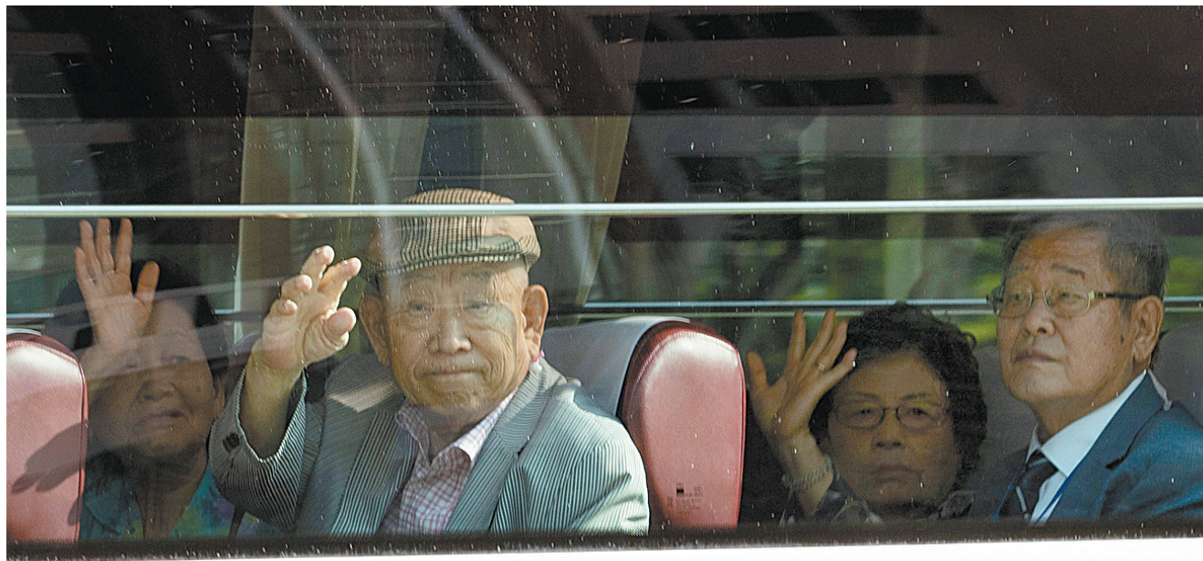
8月20日，在韩国束草，参加朝韩离散家属团聚活动的韩方人员在长途汽车内向送行人挥手致意。

王俊生说，朝美关系因在半岛无核化问题上难以取得突破性进展而陷入僵局。在此情况下，对朝鲜而言，离散家属会面活动以及即将于下个月举行的朝韩领导人平壤会晤，将有效减少朝方认为在