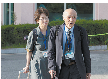
8月20日，在韩国束草，参加朝韩离散家属团聚活动的韩方人员准备搭乘长途汽车。