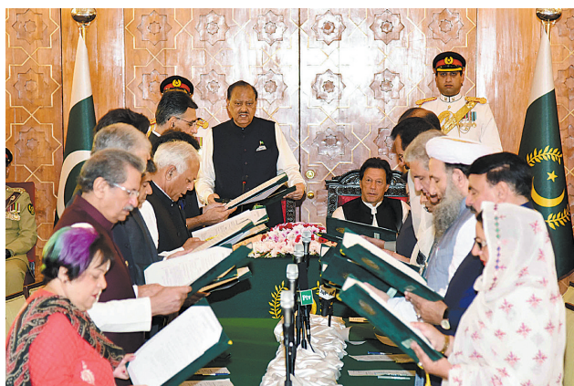
这是8月20日在巴基斯坦首都伊斯兰堡总统府拍摄的内阁宣誓就职仪式。

据新华社伊斯兰堡8月20日电(记者李伟)巴基斯坦总统侯赛因20日在总统府主持新内阁宣誓就职仪式，16名内阁部长宣誓就职。