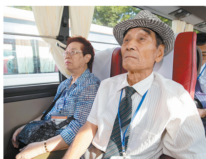
8月20日，在韩国束草，参加朝韩离散家属团聚活动的韩方人员坐在长途汽车内。