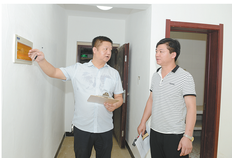
428户公租房保障家庭开始入住

员24小时到位的前提下,还要求做到主管部门、属地单位的监管人员、施工单位管理人员及区分管领导“五到位”,严格督促施工现场按照精细化要求,做好环保工作。 从上午8点到10点半,观摩团一行现场观摩了曙光街街道、湛北路街道、中兴路街道等相关街道的老旧小区改造、道路修整及墙体立面美化工作,并对饭店镇、矿冶路街道、新新街街道等镇(街道)的“散乱污”及“三堆”取缔反弹情况进行检查。观摩结束后,新华区针对观摩情况现场办公,对发现的问题进行细致梳理,提出具体整改措施,并要求该区纪检监察、政法等力量融入百城提质、环保攻坚双提升工作中。