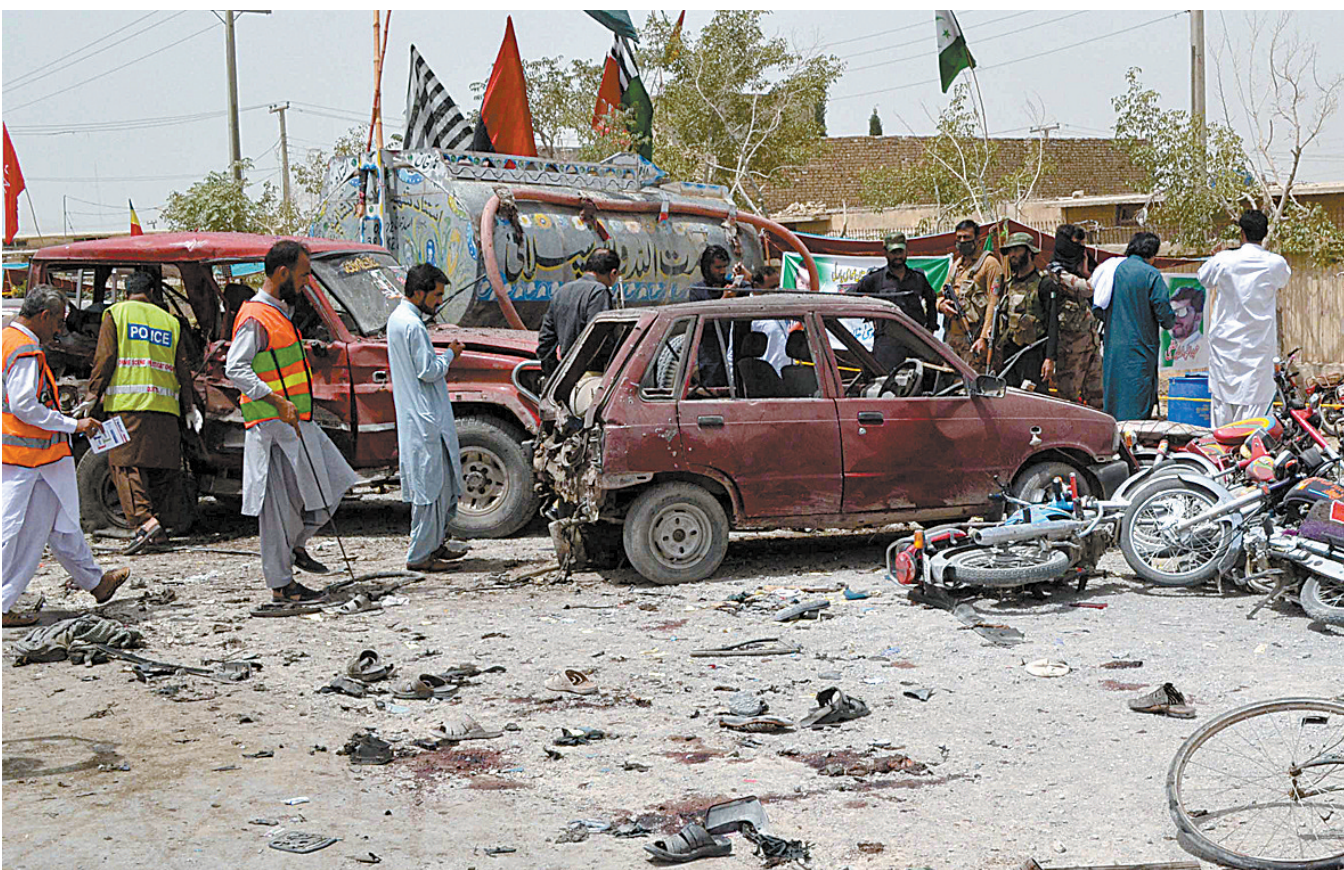
巴基斯坦一选举投票站附近发生自杀式炸弹袭击致29人死亡

和森认为,要救国救民,就要走俄国十月革命的道路,就必须建立一个革命政党。他两次致信毛泽东,一次致函陈独秀。在这些信函中,他第一次提出“明目张胆正式成立一个中国共产党”,第一次系统提出了建党理论和建党原则。毛泽东复信中说:“见地极当,我没有一个字不赞同。” 1921年12月,回国不久的蔡和森加入中国共产党,并留在中央机关从事理论宣传工作。1922年7月,蔡和森在党的二上当选为中央委员,负责党的宣传工作。9月,主编党中央机关报《向导》周报,他既是主编又是主要撰稿人。 1925年五卅运动爆发,蔡和森在其间展现出卓越的领导群众斗争的才能,并在斗争中成长为杰出的群众领袖。 1931年6月,因叛徒出卖,蔡和森被捕。在敌人的迫害下,他的生命定格在36岁。 (据新华社长沙7月25日电)