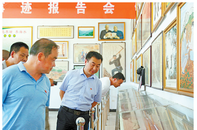
7月25日,党员们在宝丰县观林业劳模纪念馆、参加贫困村人居环境整治义务劳动等形式学习劳模事迹、坚定理想信念,用实际行动为脱贫攻坚贡献自己的力量。

该镇负责人介绍:“石画小镇培训基地需要长期收购大量符合要求的鹅卵石,将带动大牛村、何寨村、高铁村等临汝村建的建档立卡贫困户通过劳动实现增收。同时通过免费培训,将促使更多贫困户和镇村群众,掌握技术技能,实现稳定增收。”