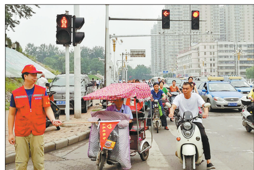
志愿者协助维持交通秩序