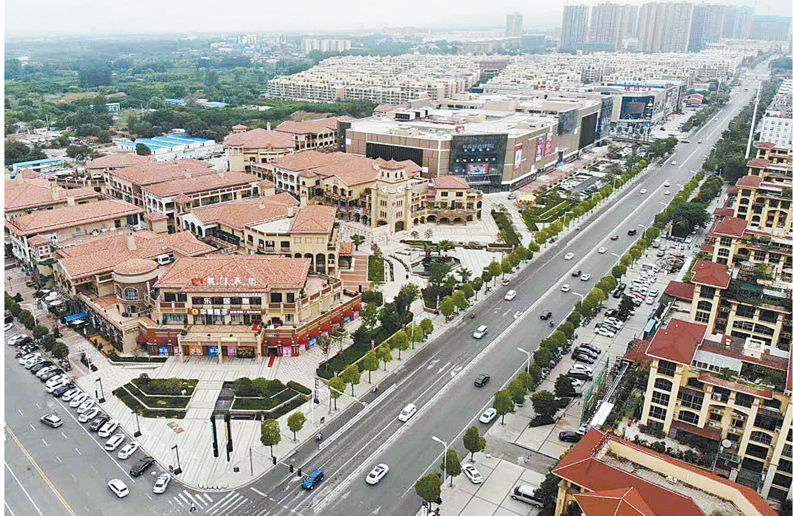
新华区特色商业区