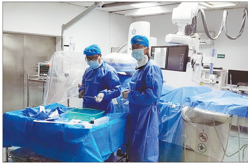
介入科医务人员为患者进行介入动脉取栓术

介入动脉取栓术是目前最新最先进且最佳的治疗手段,手术将血管内堵塞的栓子取出,使血管再通,改变预后。动脉取栓术是一项高端的介入微创治疗,对医疗设备和医师技术要求甚高,受各种因素限制,目前国内能开展血管内介入取栓的医院并不多。市一院介入团队于今年年初全面独立完成了动脉取栓