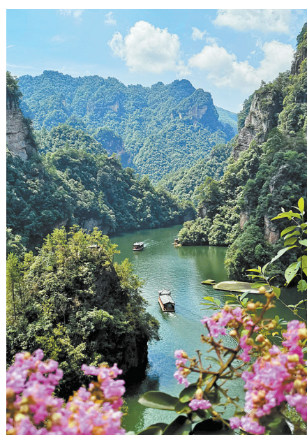
游人在张家界乘船游览

由于带有几分黄山的神韵,夏季到这座森林里写生绘画的人非常多,有兴趣的话,沿途可以观赏边偷师。(刘星彤)