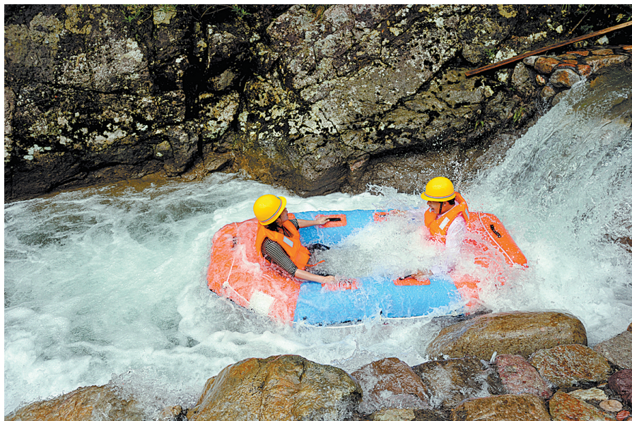
游客在牛头山漂流