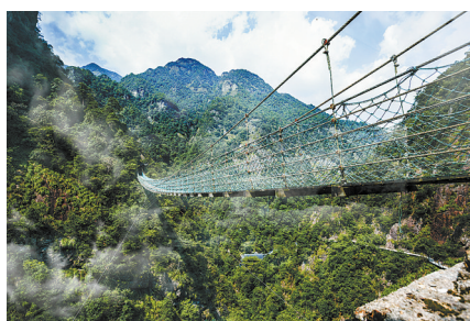
牛头山金锁桥

随着各地气温升高,人们最渴望的旅行,莫过于既能凉爽避暑,又可以“回归自然”,让心灵在高温天气中解脱出来,真正进入清新、宁静的世界的旅程。一次真正的森林浴,可以给你这样的完美体验。