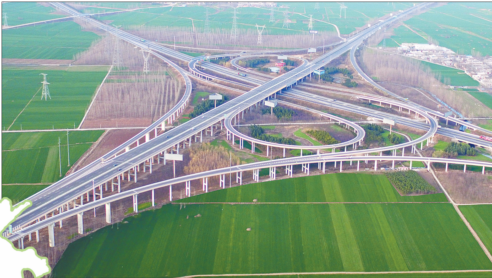
无人机航拍郑尧高速与宁洛高速交会处(资料图片)。

高举习近平新时代中国特色社会主义思想伟大旗帜,以党的十九大精神 and 习近平总书记调研指导河南时的重要讲话为指导,深入学习贯彻省委十届六次全会暨省委工作会议精神,牢牢把握以党的建设高质量推动经济发展高质量工作方向,动员全市上下牢记使命、强化担当,致力转型、勇闯新路,以更加奋发有为的姿态推动综合实力高质量重返全省第一方阵,为中原更加出彩贡献力量、增添重彩。