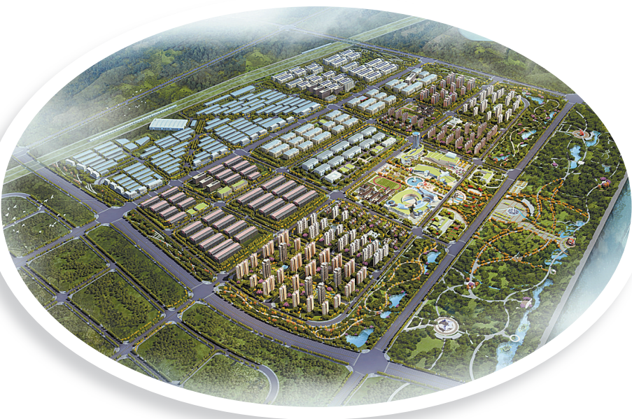
汝绣农民工返乡创业园四期效果图