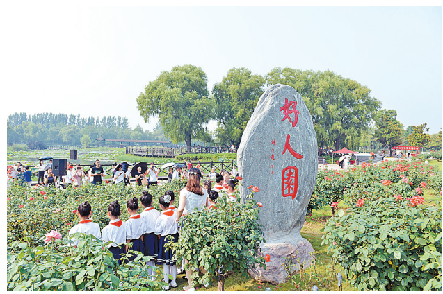
展示先进事迹 汇聚精神力量