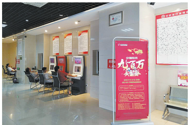
联盟路中福在线销售厅内景

6月18日,“中福在线”新一轮大派奖活动盛大开启,派奖金额高达900万元。派奖活动进行一周多以来,我市联盟路中福在线销售厅频现“金”喜,彩民朋友乐开了花。