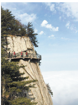
尧山亦名大龙山

鲁山有母猪山、母猪峡。叶县有山名老母猪头，村庄有猪头李、杀猪王。舞钢有母猪峡。 综上，可以毫不犹豫地肯定，平顶山地域泄水、汝水流域是中华十二生肖文化核心发源区的重要支撑点。