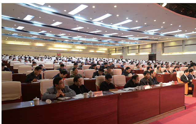
全市安全生产工作会议