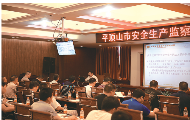
全市安全生产执法业务培训