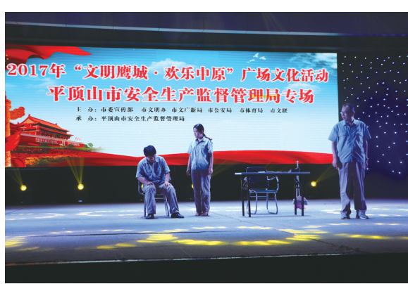
安全生产广场文化活动