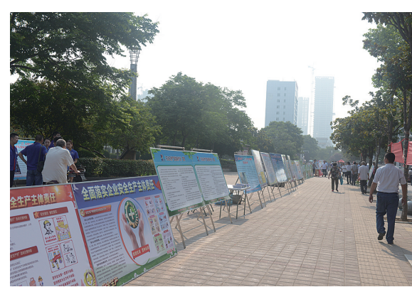
安全生产月宣传日活动现场