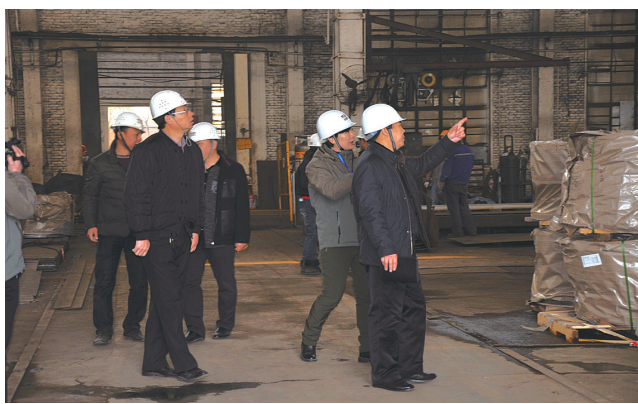
深入企业开展执法检查