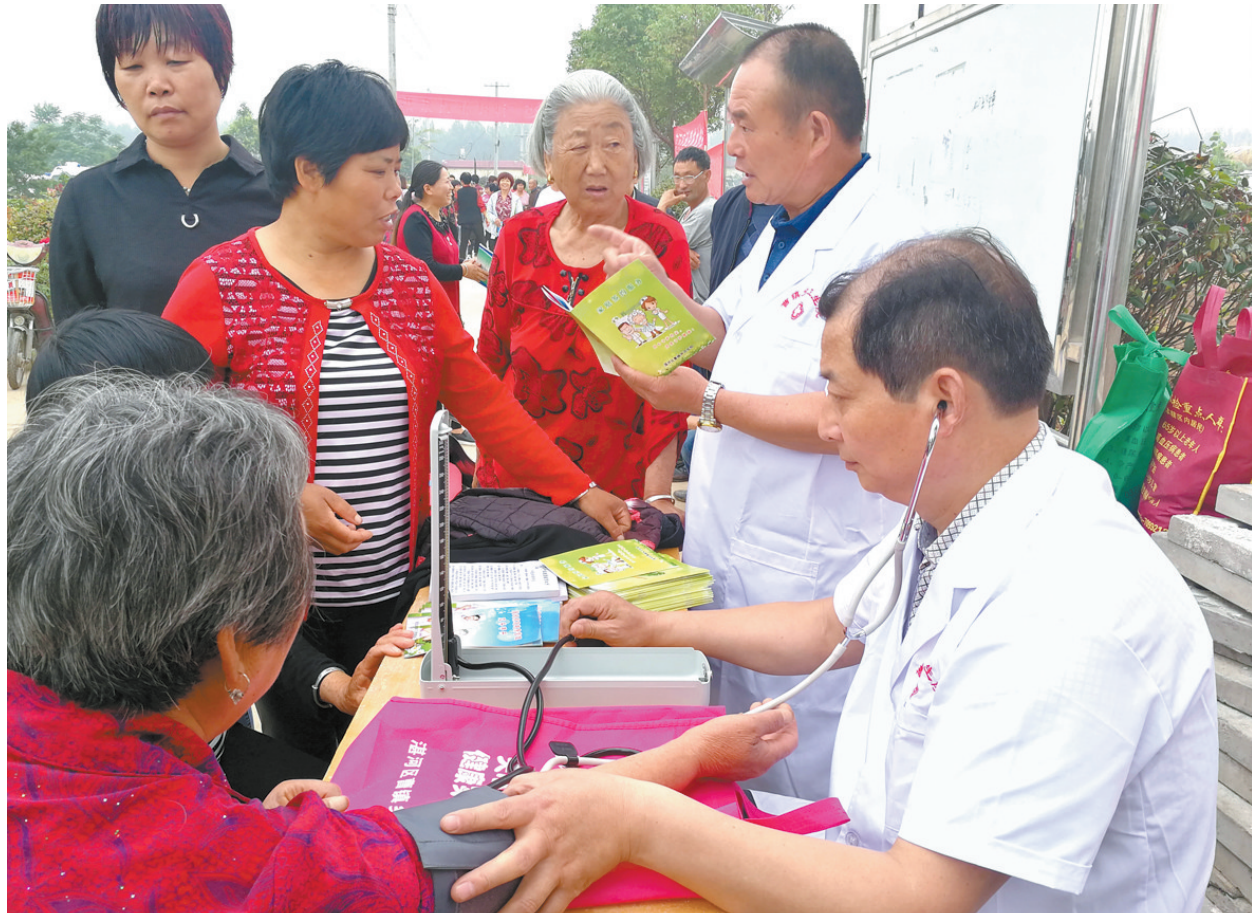
5月29日,湛河区曹镇乡卫生院的医护人员在李庄村给村民义诊。为了普及健康知识并持续关注村民的健康状况,湛河区曹镇乡卫生院每周定时组织医护人员深入各个村庄给村民义诊,并现场宣传健康生活相关知识。

来自湛河区妇幼保健院的妇幼健康专家就规范开展母婴阻断工作的相关知识、检测技术、生物安全和项目信息管理等内容进行了讲解,强调各医疗卫生机构要结合孕产期保健和助产服务,主动为所有孕产妇提供艾滋病、梅毒和乙肝母婴传播的检测与咨询服务,同时动员适龄妇女尽早进行相关检查。