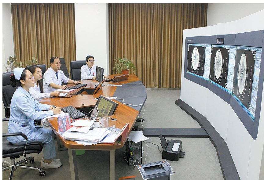
市第一人民医院的专家正在进行远程会诊。

2015年,依托省、市十大民生工程,市一院牵头承担省远程医学中心平顶山分中心建设任务。该中心总投资800多万元,建筑面积1700平方米,为全市