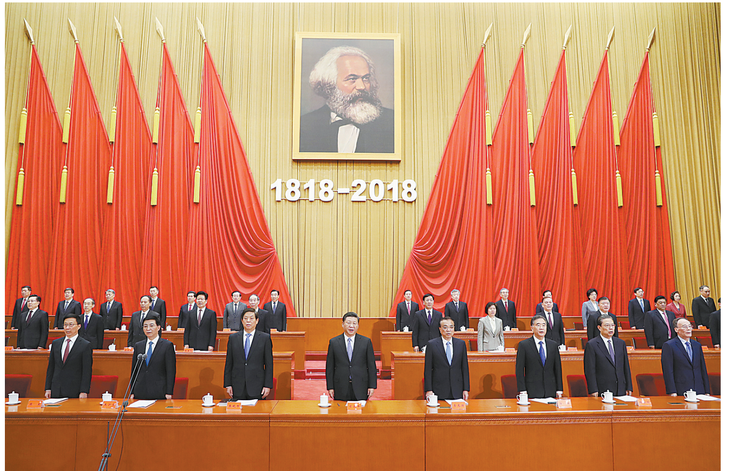
5月4日,纪念马克思诞辰200周年大会在北京人民大会堂隆重举行。习近平、李克强、栗战书、汪洋、王沪宁、赵乐际、韩正、王岐山等出席大会。

新华社北京5月4日电 (记者张晓松 黄小希)纪念马克思诞辰200周年大会4日上午在北京人民大会堂隆重举行。中共中央总书记、国家主席、中央军委主席习近平在会上发表重要讲话强调,我们纪念马克思,是为了向人类历史上最伟大的思想家致敬,也是为了宣示我们对马克思主义科学真理的坚定信念。马克思主义始终是我们党和国家的指导思想,是我们认识世界、把握规律、追求真理、改造世界的强大思想武器。新时代,中国共产党人仍然要学习马克思,学习和实践马克思主义,高举马克思主义伟大旗帜,不断从中汲取科学智慧