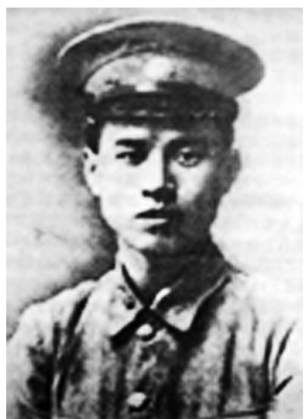
蒋先云烈士像(资料照片)。

位于湖南省新田县大坪塘村的蒋先云故居,作为湖南省爱国主义教育基地,每到清明时节,社会各界群众和中小學生自发前往悼念这位革命英烈。