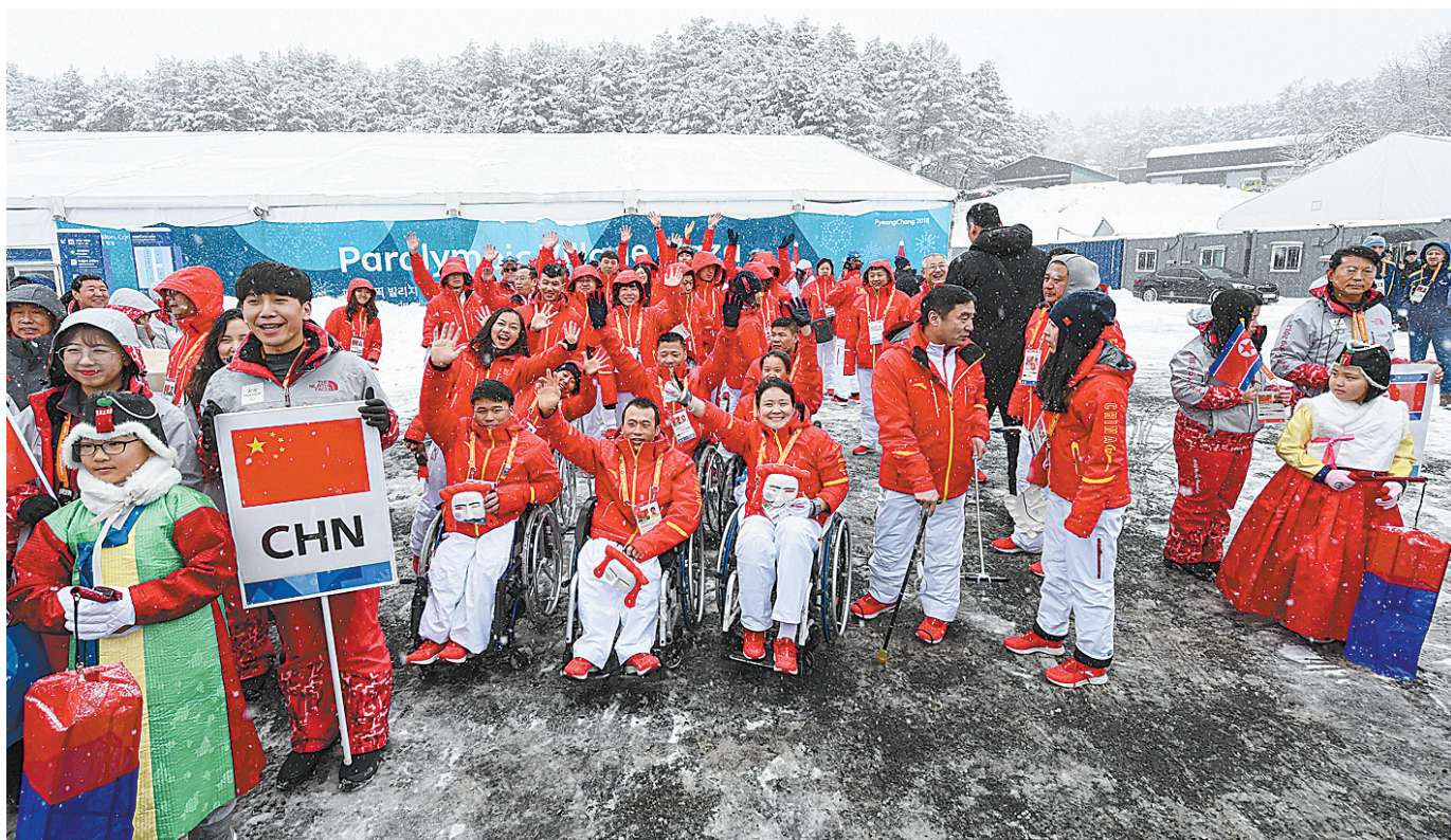
3月8日,中国体育代表团在升旗仪式现场合影。当日,2018年平昌冬季残奥会中国体育代表团升旗仪式在韩国平昌运动员村举行。

第12届冬季残奥会将于9日在平昌拉开帷幕。本届中国代表团由运动员、教练员和团部工作人员共60余人组成,其中运动员26人,将参加5个大项、30个小项的比赛。这是我国参加冬季残奥会以来,参赛运动员人数和参赛项目最多、代表团规模最大的