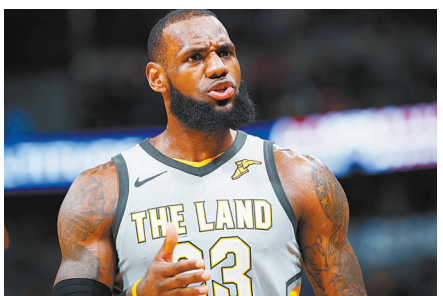
3月7日,骑士队球员詹姆斯在比赛中。

新华社华盛顿3月7日电 在7日进行的NBA常规赛中,火箭在客场110:99战胜雄鹿,取得17连胜。骑士在客场113:108战胜掘金,詹姆斯在比赛中拿到39分。