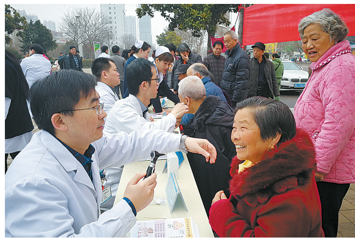
“爱耳日”义诊 3月3日上午,医护人员在鹰城广场为市民义诊,并现场讲解爱耳、护耳知识。当日是第19次全国爱耳日,主题是“听见未来,从预防开始”。当日上午,平煤医疗集团总医院、市第二人民医院等分别组织专科医护人员,在市区鹰城广场开展义诊宣传活动,现场为市民进行耳部疾病检查,向市民宣传各种爱耳、护耳知识。

贺建功介绍,对于常见的乳腺炎、乳腺增生、乳头皲裂、中医乳痛等病症,中医药的阴阳辨证以及中医热疗、针灸、特色止痛膏剂的综合治疗效果更加确切。此外,由中医普外科和妇产科相结合开展的特色催乳疗法为众多哺乳期缺乳女性提供了专业化的治疗。该院中西医并重治疗为女性乳腺健康提供了全方位、一站式服务,惠及了高龄乳腺癌、乳腺纤维瘤、断经溢乳综合征、肉芽肿性乳腺炎、浆液性乳腺炎患者,让众多深受乳腺疾病困扰的患者得到了专业、确切的诊疗。