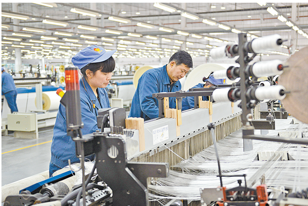
2017年10月1日上午，平顶山神马化纤造有限公司员工坚守在生产一线。该公司是我市打造“中国尼龙

此外，我市组织各县(市、区)参加了第十一届中国(河南)国际投资贸易洽谈会、第十届中国(安徽)中部投资贸易博览会、亚洲商品贸易博览会、中国—东盟博览会，自主举办了平顶山市情说明暨