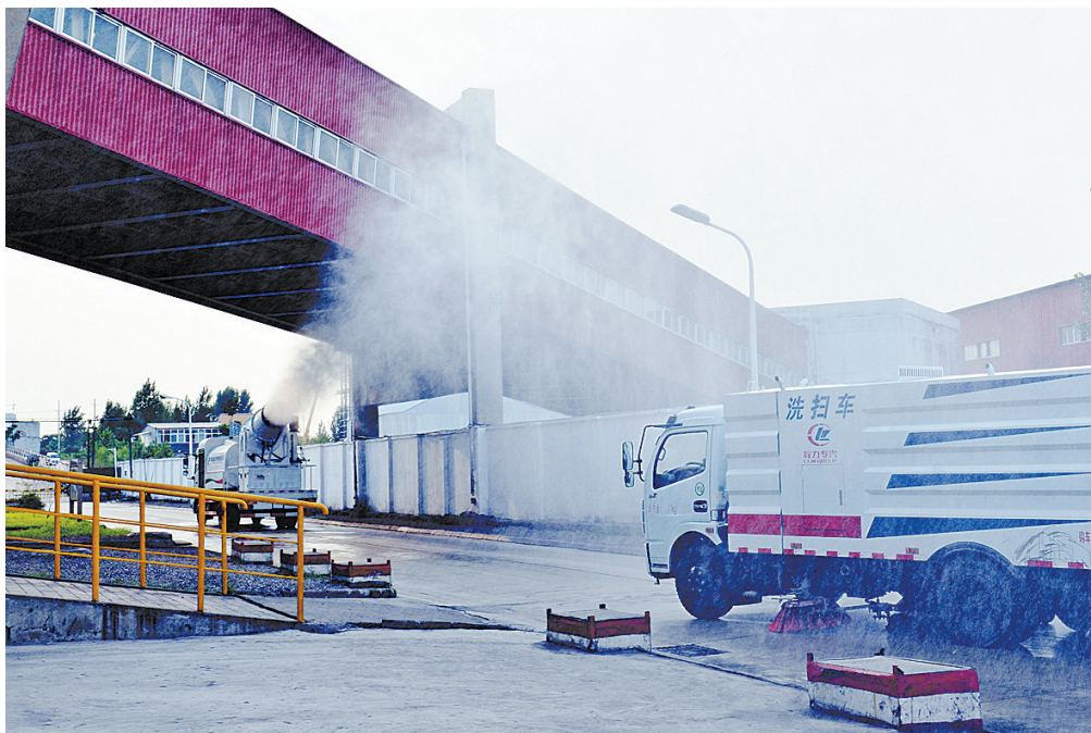
淇河区环卫局的多功能抑尘车在一家企业内进行喷淋降尘作业(资料图片,摄于2017年9月18日)。