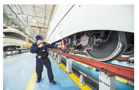
春运大幕即将开启

挥先发优势的引领型发展。三是要积极推动城乡区域协调发展,优化现代化经济体系的空间布局,实施好区域协调发展战略,推动京津冀协同发展和长江经济带发展,同时协调推进粤港澳大湾区发展。乡村振兴是一盘大棋,要把这盘大棋走好。四是要着力发展开放型经济,提高现代化经济体系的国际竞争力,更好利用全球资源和市场,继续积极推进“一带一路”框架下的国际交流合作。五是要深化经济体制改革,完善现代化经济体系的制度保障,加快完善社会主义市场经济体制,坚决破除各方面体制机制弊端,激发全社会创新创业活力。