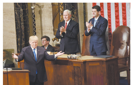
特朗普发表首次国情咨文演讲

1月31日,在南京动车运用所检修库内,工作人员在检查“复兴号”列车的走行部,保障春运期间运输安全。2018年春运将于2月1日启幕,至3月12日结束,共计40天。