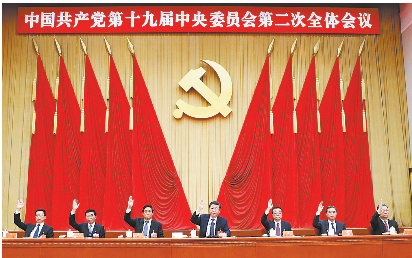
中国共产党第十九届中央委员会第二次全体会议,于2018年1月18日至19日在北京举行。中央政治局主持会议。

新华社北京1月19日电 中国共产党第十九届中央委员会第二次全体会议公报(2018年1月19日中国共产党第十九届中央委员会第二次全体会议通过)中国共产党第十九届中央委员会第二次全体会议,于2018年1月18日至19日在北京举行。出席这次会议的有,中央委员203人,候补中央委员172人。中央纪律检查委员会常务委员会委员和有关方面负责同志列席会议。党的十九大代表中部分基层同志和专家学者也列席会议。全会由中央政治局主持。中央委员会总书记习近平作了