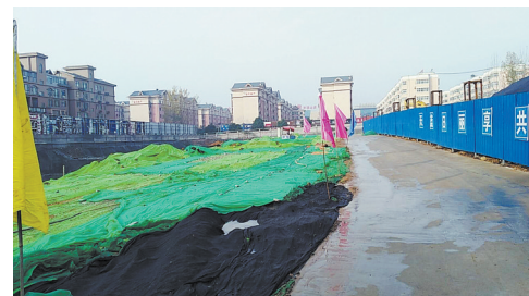
建筑工地“封土行动”