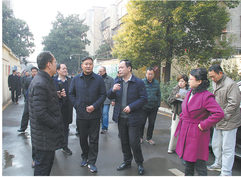
新华区委书记乔彦强(前排左三)检查庭院提档升级工作

环保攻坚仍在继续，2018年也必将记录下新华区为美好环境和努力的铿锵脚步。新华人，初心不变，再出发。