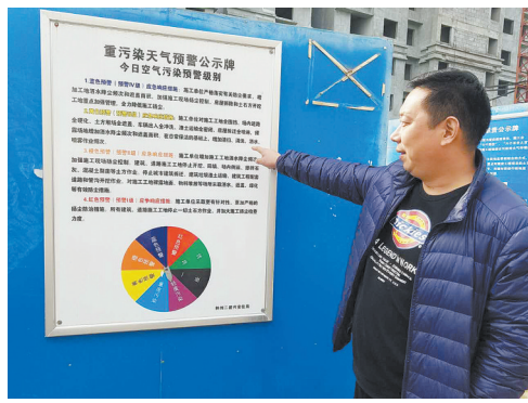
工地设置天气预警公示牌

“幸福都是奋斗出来的。”把“天蓝地绿水清”的蓝图变为现实，需要不驰于空想、不骛于虚声的奋斗精神，需要一步一个脚印踏踏实实干好工作。在打赢环境污染防治攻坚战的路上，新华人逢山开路，遇水架桥，精准施策，奋战到底。