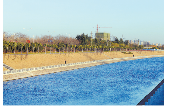
新华区焦店镇高庄村段的湛河河道水清河畅，景色宜人