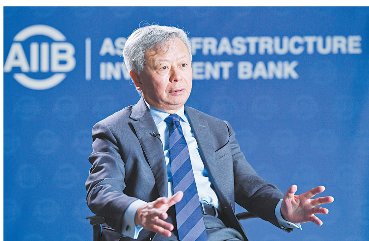
1月11日,亚投行行长金立群接受记者专访。

“亚投行不受任何政治干预,不卷入任何国际上或成员之间的政治纠纷,一切着眼于推动区域经济社会发展,改善参与国家和地区的人民福祉。”金立群说,越来越