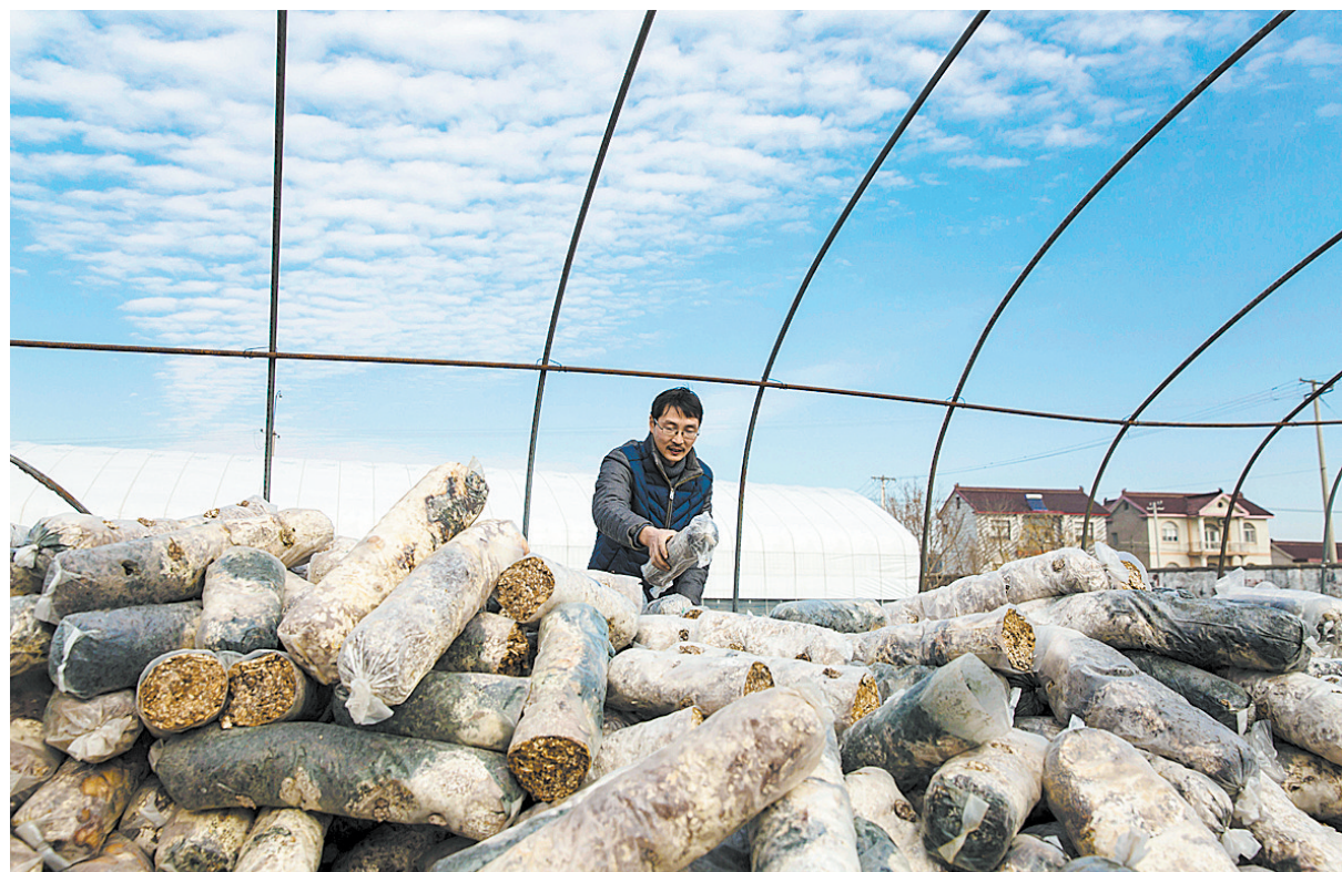
推动农业转型发展

川、淮滨至息县等多条秦巴山区、大别山区外通内联高速公路,截至目前,贫困地区高速公路达到2903公里,占全省的45%。 “十三五”期间,河南省将加快推进内河水运项目建设,带动沿线贫困地区发展,补齐河南省交通基础设施短板。 到2019年,河南省贫困地区所有行政村将实现通路、通邮、通班车,区域交通运输发展整体达到全省平均水平。