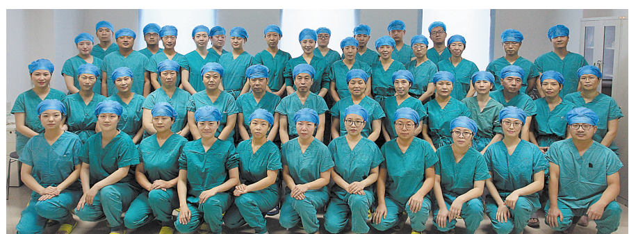
市第一人民医院手术麻醉科医护人员