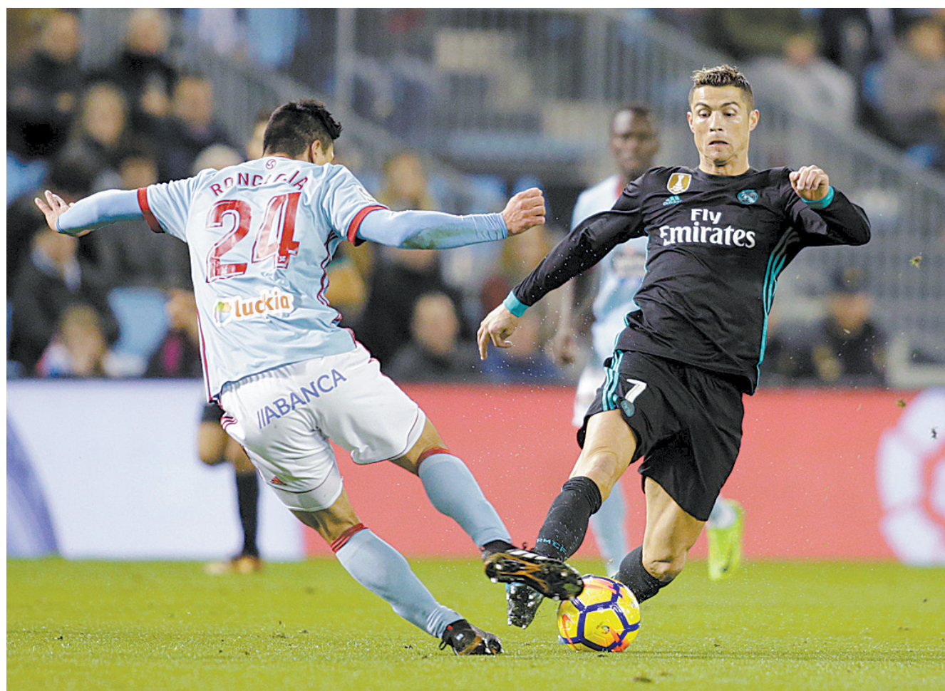
1月7日，皇家马德里队球员克里斯蒂亚诺·罗纳尔多(右)在比赛中突破。