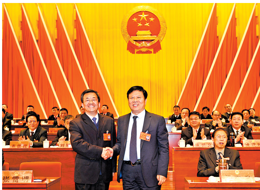
市委书记周斌(右)向新当选的市长张雷明(左)表示祝贺。