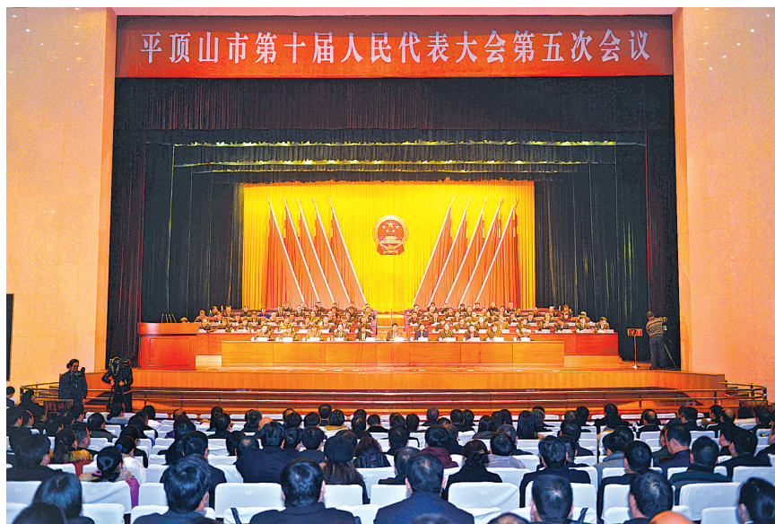
1月8日,平顶山市第十届人民代表大会第五次会议在市会议中心闭幕。

43人当选为河南省第十三届人民代表大会代表 张雷明当选为平顶山市人民政府市长 李建民当选为平顶山市监察委员会主任 侯民义当选为平顶山市人民检察院检察长