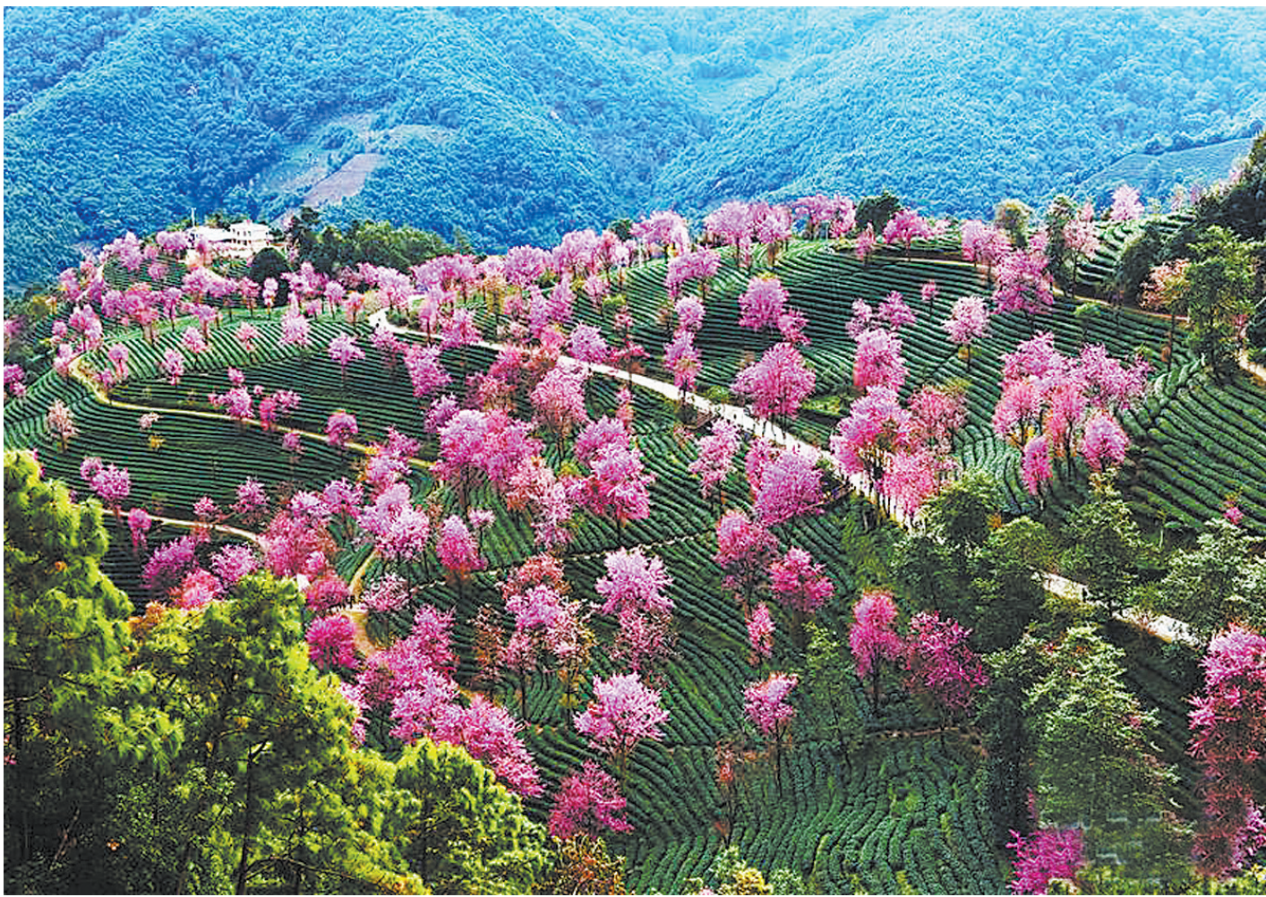
云南南涧：冬日樱花醉游人

“我能想到最浪漫的事，就是和你一起慢慢变老，一路上收藏点点滴滴的欢笑，留到以后坐着摇椅慢慢聊。我能想到最浪漫的事，就是和你一起慢慢变老，直到我们老的哪儿也去不了，你还依然把我当成手心里的宝。”这时，电视里响起这首曾经非常熟悉、非常喜欢的歌曲。我不由得笑了，好婚姻是需要认真经营的，或许真的应该好好纪念一下。