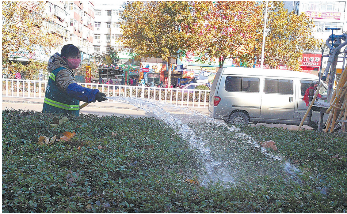
12月5日，市园林处绿化队员工在市区建设路中段冲洗绿化带内的植被。为做好环境污染防治工作，市园林处绿化队组织员工对绿化带内的植被进行冲洗，避免风起扬尘造成大气污染。

本报讯(记者杨沛洁)12月5日上午，叶县政府督察室副主任李福义来到该县环保局报到。“这标志着咱的环保综合督查组成立了。”叶县环保局局长李耀云说。 12月4日，该县召开了冲刺30天(12月)大气污染防治攻坚工作会议，在传达上级相关工作精神的同时，对全县下一步工作进行了部署，尤其对环保督查工作进行了安排。 该县境内有G234等国道、省道长达230多公里，仅红绿灯下的