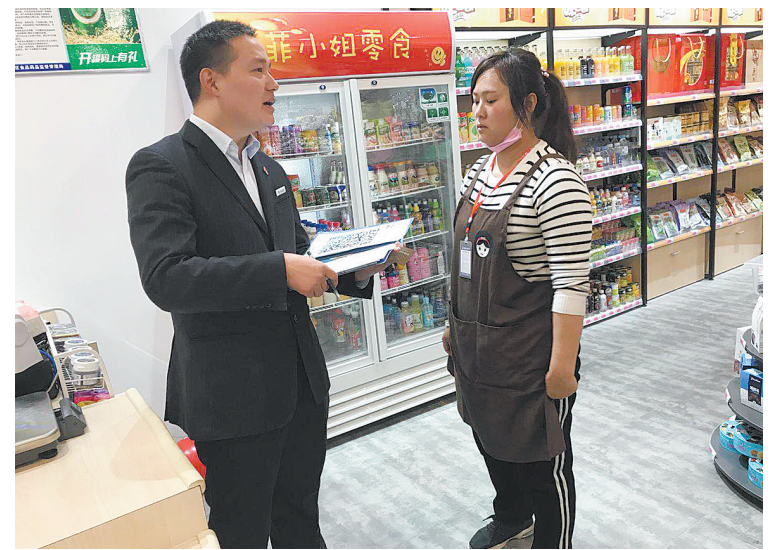
交行金融服务宣传进商场

“对于经常开车出行的人,三责险保额要充足。”该人士表示,天冷路滑,车辆连环追尾事故多发。由于连环追尾事故的涉险车辆、车主数量大,汽车保险事故现场情况复杂,所以车主在购买车险时一定要买足商业三责险,一旦发生事故可减少损失。(刘稳)