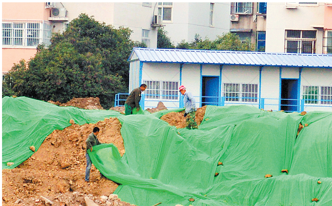
落实环保措施 治理扬尘隐患

入冬以来,该城管执法大队夜班执法人员已处理渣土车案件25起,开具罚单5(车)次;处理擅自夜间施工工地案件12起,下达整改通知书20份。