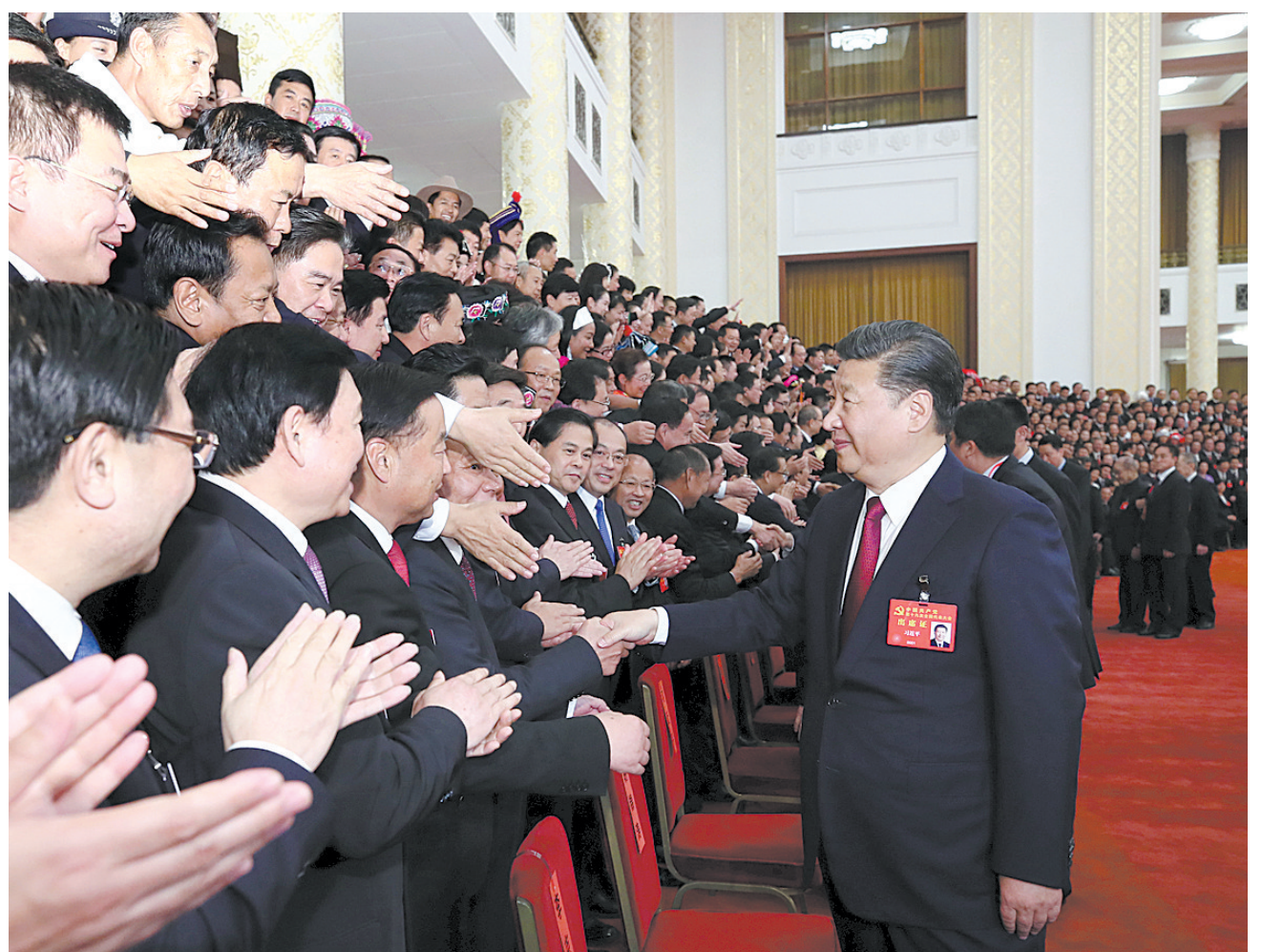
10月25日下午,中央领导同志在北京人民大会堂同出席党的十九大代表、特邀代表和列席人员合影留念。这是习近平同志与代表亲切交谈。

新华社北京10月25日电 中共中央总书记、国家主席、中央军委主席习近平25日下午在人民大会堂亲切会见了出席党的十九大代表、特邀代表和列席人员,并同大家合影留念。