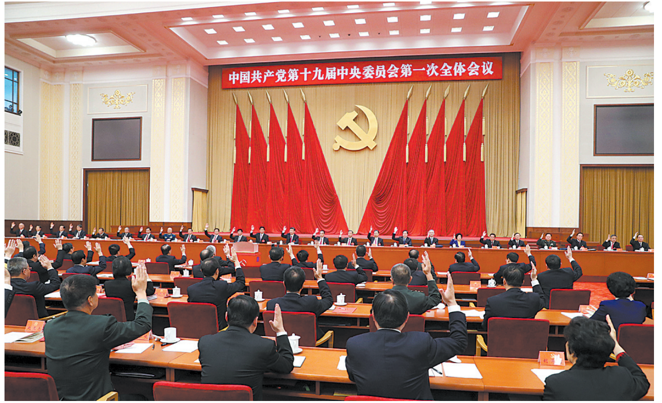
左图:10月25日,中国共产党第十九届中央委员会第一次全体会议在北京人民大会堂举行。习近平同志主持会议并作重要讲话。