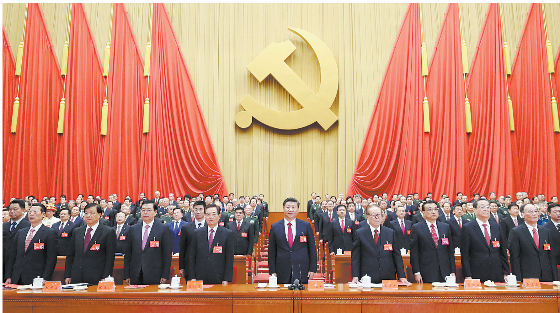
10月24日,中国共产党第十九次全国代表大会在北京人民大会堂胜利闭幕。这是习近平、李克强、张德江、俞正声、刘云山、王岐山、张高丽、江泽民、胡锦涛在主席台上。

新华社北京10月24日电 中国共产党第十九次全国代表大会在选举产生新一届中央委员会和中央纪律检查委员会,通过关于十八届中央委员会报告的决议、关于十八届中央纪律检查委员会工作报告的决议、关于《中国共产党章程(修正案)》的决议后,24日上午在人民大会堂胜利闭幕。