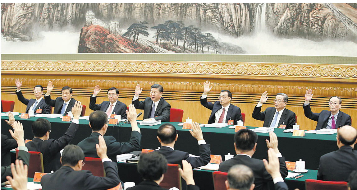
10月23日,中国共产党第十九次全国代表大会主席团在北京人民大会堂举行第四次全体会议。右图为习近平、李克强、张德江、俞正声、刘云山、王岐山、张高丽等出席会议。