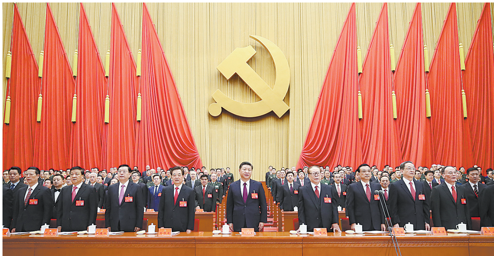
10月18日,中国共产党第十九次全国代表大会在北京人民大会堂开幕。这是习近平、李克强、张德江、俞正声、刘云山、王岐山、张高丽、江泽民、胡锦涛、新华社记者 兰红光 摄

新华社北京10月18日电 会就伟大梦想新蓝图,开启伟大事业新时代。举世瞩目的中国共产党第十九次全国代表大会18日上午在人民大会堂开幕。