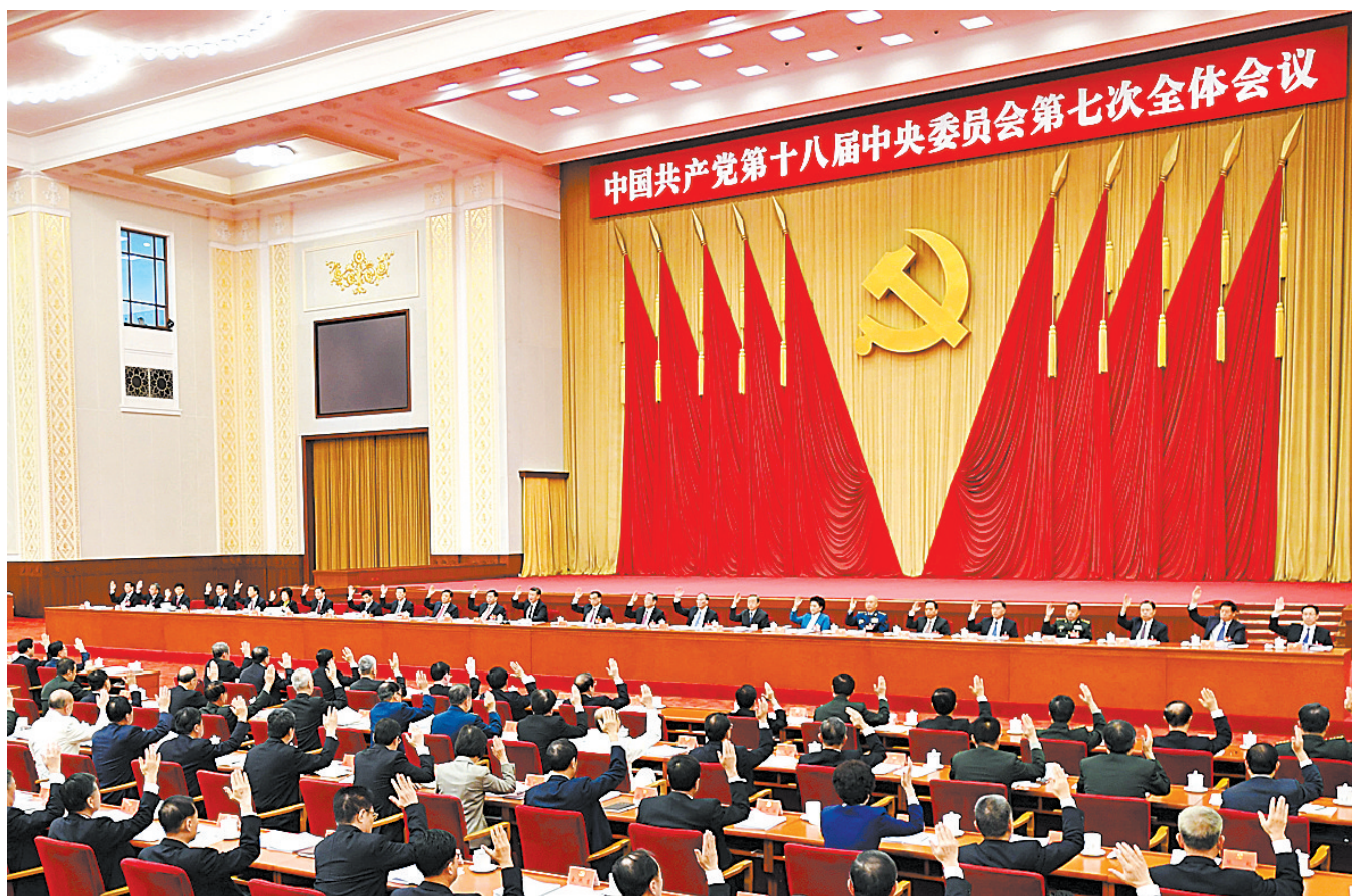
中国共产党第十八届中央委员会第七次全体会议,于2017年10月11日至14日在北京举行。中央政治局主持会议。