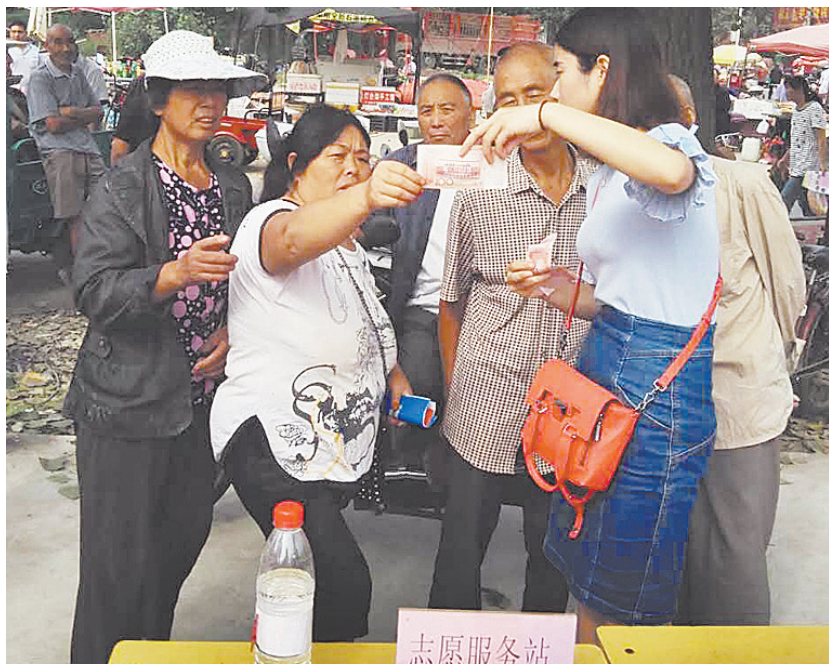
人民银行平顶山中心支行工作人员深入扶贫帮扶点——舞钢市杨庄乡魏庄村开展金融知识宣传。

本报讯（记者张秀玲）记者从人行平顶山中心支行了解到，2017年人民银行金融知识普及月活动近日拉开序幕，并确定2017年金融知识普及月活动口号为：“普及金融知识，提升金融素养，防范金融风险，共建和谐金融。”