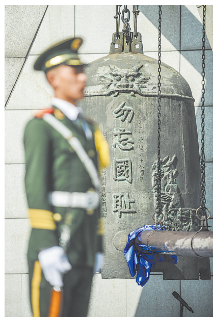
9月18日拍摄的勿忘“九一八”警钟鸣警仪式现场。

9月16日,在美国密苏里州圣路易斯市,一名抗议者被送上救护车。 据美国媒体17日报道,由于枪杀黑人的警察被判无罪,美国密苏里州圣路易斯市16日晚发生暴力抗议活动,造成一些商店被砸,9名警察受伤。当地法官15日宣布,由于证据不足,被控于2011年枪杀非洲裔青年的圣路易斯市前警察贾森·斯托克利被判无罪。2011年12月20日,斯托克利在一次执行任务的过程中枪杀了24岁的安东尼·拉马·史密斯。斯托克利声称,他当时怀疑史密斯在贩毒并且试图拿起车上的枪,因而开枪将史密斯打死。