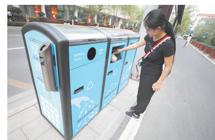
环保智能垃圾箱亮相济南

体责任,以行动作无声的命令,以身教作执行的榜样。要聚焦问题,针对群众反映强烈的突出问题,扭住不放、持续发力、铁面执纪,集中解决形式主义、官僚主义、享乐主义和奢靡之风。要标本兼治,注重用制度治党管权治吏,用改革的思路和方法破解作风顽症,着力从体制机制上堵塞漏洞。 会议强调,全面从严治党永远在路上,作风建设永远在路上。贯彻落实中央八项规定精神、转变作风只能加强不能削弱。要保持战略定力,坚持问题导向,锲而不舍、持之以恒,强化责任、强化督查、强化查处,不断把作风建设引向深入,努力使党的作风全面好起来,确保党同人民群众始终同呼吸、共命运、心连心。 会议还研究了其他事项。