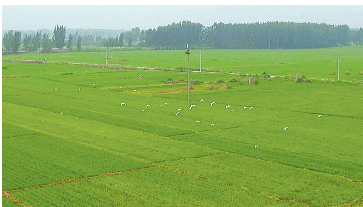
曹镇生态水稻田里白鹭起舞