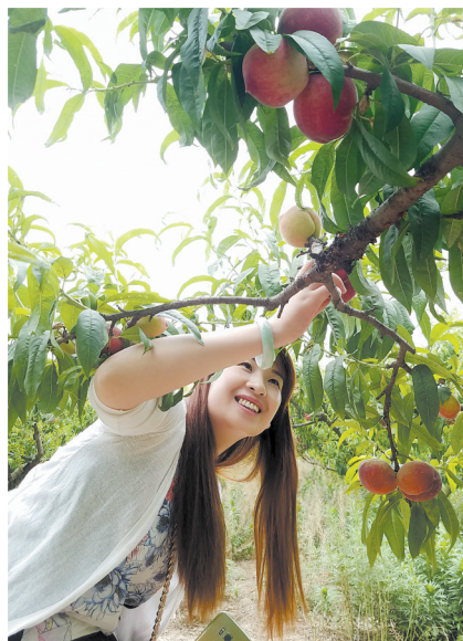
游客在潘庄村采摘蜜桃

●资源优势：曹镇特色肉内在平顶山市连锁店已经达到40余家，曹镇原生大米、曹镇特色米线远销港澳台，源于北宋宫廷的曹镇水席在河南南部广为流传，曹镇香菇酱远销东南亚等国家和地区，为众多游客平添了向往之情。