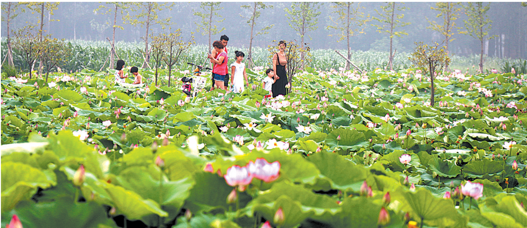
齐务荷园

“历史古镇”“鱼米之乡”“北国江南”“现代农业特色示范园区”……在湛河区委、区政府和30万人民的共同努力下，曹镇乡这一张张烫金的名片必将更加熠熠生辉，湛河区将由此迈向文化经济的全面腾飞！