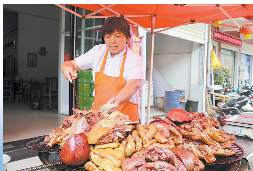
刚出锅的曹镇卤肉香味扑鼻