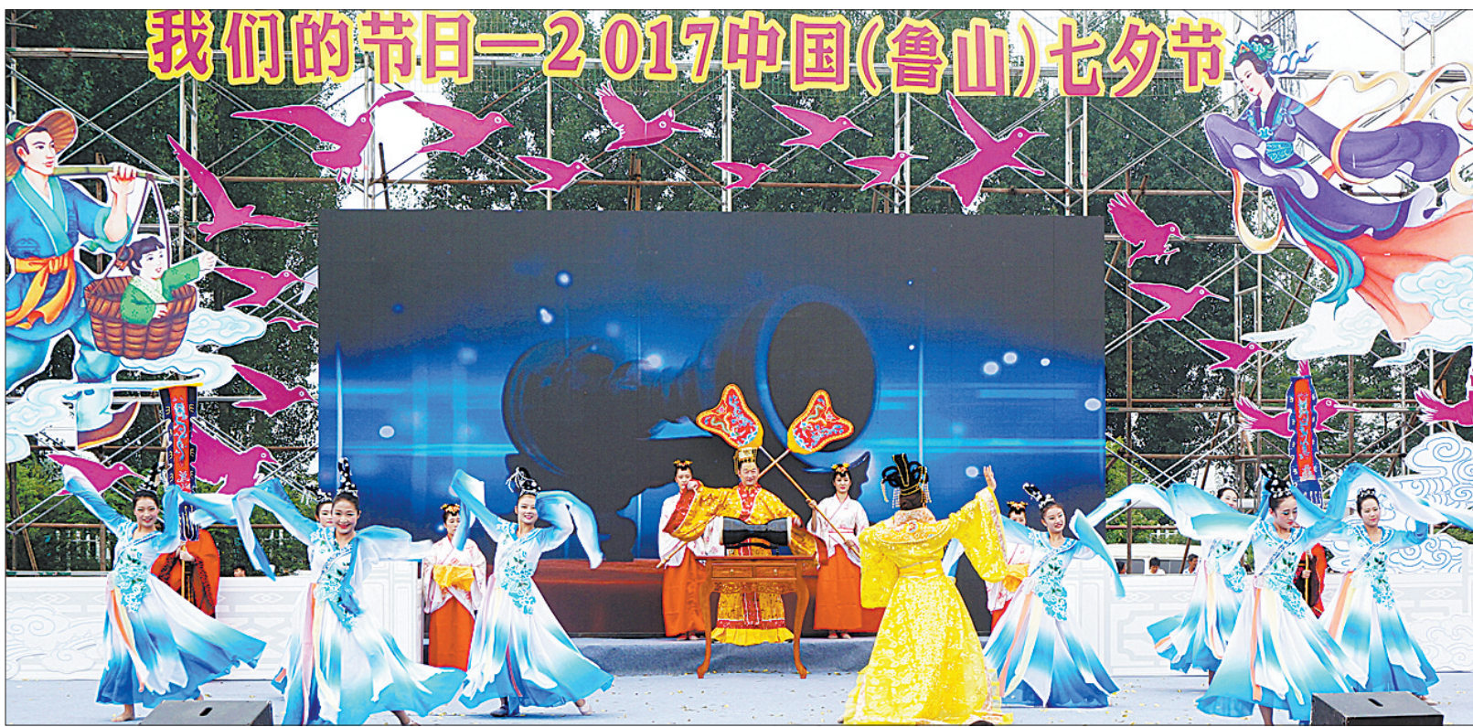
演员在表演舞蹈《唐风霓韵》