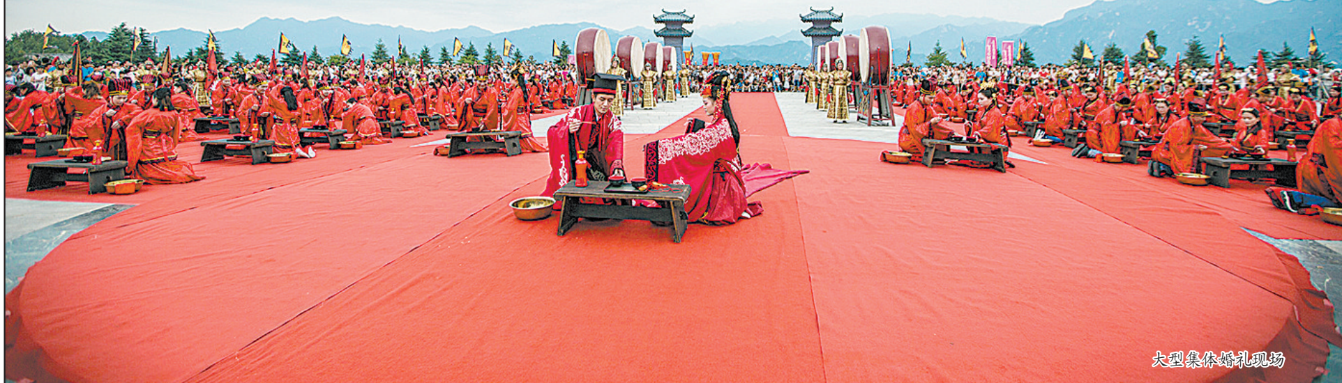
大型集体婚礼现场