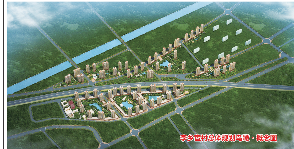
李乡宦村总体规划鸟瞰·概念图

李乡宦城中村改造二期工程位于姚电大道西段，东至稻香路，南至宁洛高速，西至姚孟村，北至湛河。项目占地163亩，规划建筑面积约36万平方米。根据《平顶山市城乡规划局关于湛河区姚电大道西段李乡宦村进行规划的复函》(平规设函[2017]4号)文件精神，改造地块依据路网划分为A1、A2、A3地块。A1地块为李乡宦村部分村民拆迁安置房，A2、A3地块规划建设高品质住宅小区。