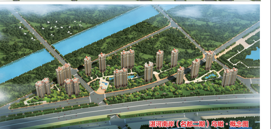
湛河南岸(名都二期)鸟瞰·概念图