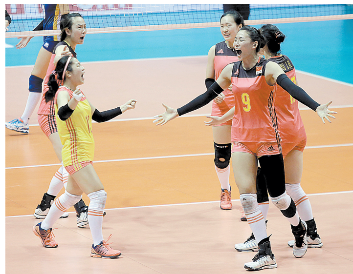
8月15日，中国队球员在赛后庆祝胜利。当日，在菲律宾举行的亚洲女排锦标赛四分之一决赛中，中国队以3:0战胜哈萨克斯坦队，跻身四强。