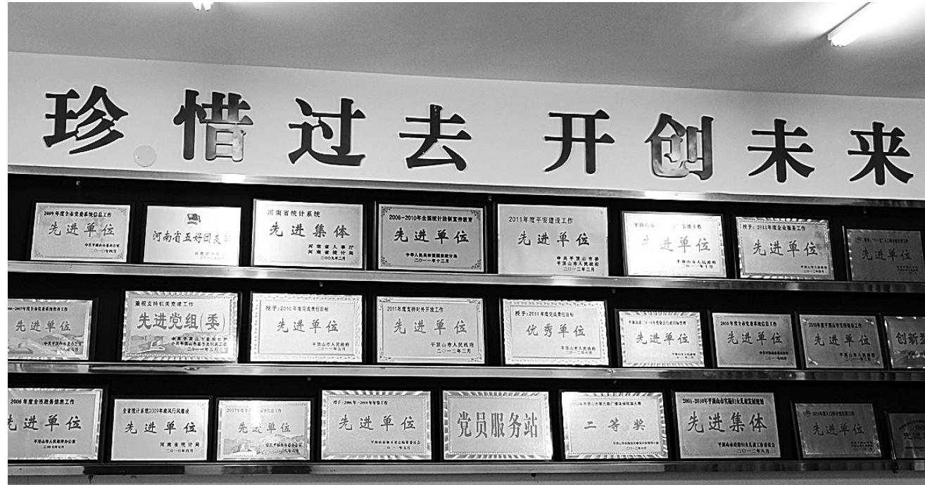
荣誉承载过去,奋斗引领未来

坚持“服务塑统”。建立健全国民经济核算体系,记录全市经济社会各个领域发展的总量、结构和运行态势;开展人口普查、经济普查、农业普查等周期性重大国情国力普查,为党委、政府提供基础