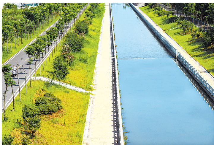
8月3日,香山管委会石桥营村附近的淇河绿意盎然、碧波荡漾。新华区高度重视淇河治理工作,持续投入人力、物力、财力,目前,淇河治理工作成效显著。

本报讯(记者毛玺玺 通讯员朱彦辉)“2017年7月1日,中央印发《关于修改〈中国共产党巡视工作条例〉的决定》。条例第一条增加党内政治生态;第三条增加治国理政新理念新思想新战略……”8月9日上午,新华区纪检监察巡察干部集中学习新修改的《中国共产党巡视工作条例》。该区纪委要求,纪检监察巡察干部把学习贯彻新《条例》作为重大政治任务,深刻认识、准确把握,坚决落实《条例》新精神新要求新部署,以实际行动不断深化政治巡察巡察,为全面从严治党提供有力支撑。要领会精神实质,提升能力素质。结合“讲忠诚、守纪律、做标杆”活动,学深悟透精神,准确把握内涵。同时,要了解区委、区政府重大决策部署以及行业部门主要工作内容,增强服务全局的能力水平。要提高政治站位,突出问题导向。督促被巡察党组织,特别是主要领导干部切实承担起管党治党的政治责任,把“四个意识”体现在思想和行动上。要认真履行职责,推动全面从严治党。加强对被巡察党组织整改情况的监督检查,特别是执纪监督的4个部室要加强对联系单位的日常监督,坚决把整改责任压下去,督促责任单位查漏洞、补短板。对巡察巡察整改不到位、组织领导巡察巡察工作不力、不履行或者不正确履行党内监督责任的,要及时开展约谈、函询、诫勉谈话等工作,督促落实“两个责任”。积极探索巡察工作和纪检组(纪委)日常监督工作有效结合的方式,让纪检组(纪委)真正成为“常驻不走的巡察组”,为辖区风清气正的环境当好“护林员”。