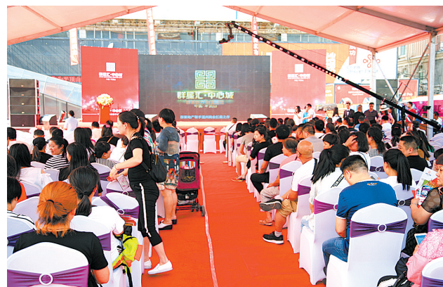
近日,群星汇·中心城“中兴路完美收官,矿工路稀缺旺铺压轴登场”发布会举行。群星汇·中心城中兴路区域市政工程暨人防工程项目去年10月20日正式施工,今年1月20日路面按时完工通车。目前,项目土建工程已完成总体进度的60%,整个项目明年建成投用。项目招商工作已完成80%,成功吸引来自全国各地的100多个知名品牌入驻。