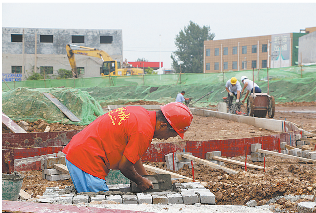
8月8日,在华耀城项目施工现场,工人们正在紧张施工。投资100亿元、占地2600亩、建筑面积300万平方米的华耀城项目,位于新华区辖区内。新华区计划在城区西部打造一座产业新城,引领经济转型发展。在市华耀城项目协调领导小组大力支持下,目前该项目区域签订安置补偿协议1004户,拨付资金2.1亿元,补偿征收土地1711亩,搬迁住宅381户,项目招商中心钢结构施工已完成。