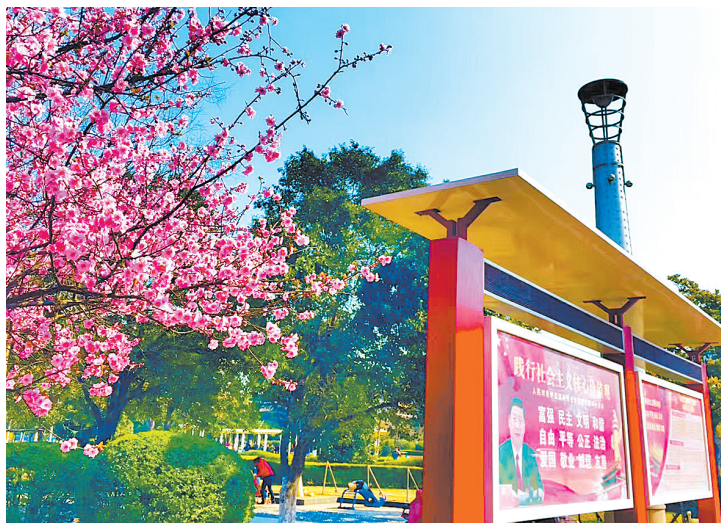
鹰城广场附近,桃花疏影里,新华区社会主义核心价值观宣传栏格外醒目(资料图片)

本报讯(记者毛玺玺 通讯员李琼琼)“从近期督查情况看,街道、社区、学校创建文明城市总体情况良好,一些医院、商场在细节方面存在漏洞。”8月3日,新华区文明办有关负责人说,随着全国文明城市提名城市创建考核验收日益临近,为进一步推进新华区创建全国文明城市工作,该区对照测评体系,强化宣传力度,坚持问题导向,以督促“改”、以查促“纠”为抓手,全面加强联系沟通,同时要积极引导群众参与文明创建,努力营造浓厚的创建氛围,各相关单位要尽快梳理存在的问题,并对有关问题进行现场交办,落实限期整改要求。督查中,督查组随时发现问题,随时对相关负责人进行现场指导,并责令经营者限期整改。“各相关部门要进一步加强联系沟通,同时要积极引导群众参与文明创建,努力营造浓厚的创建氛围,各相关单位要尽快梳理存在的问题,并对有关问题进行现场交办,落实限期整改要求。督查中,督查组随时发现问题,随时对相关负责人进行现场指导,并责令经营者限期整改。”